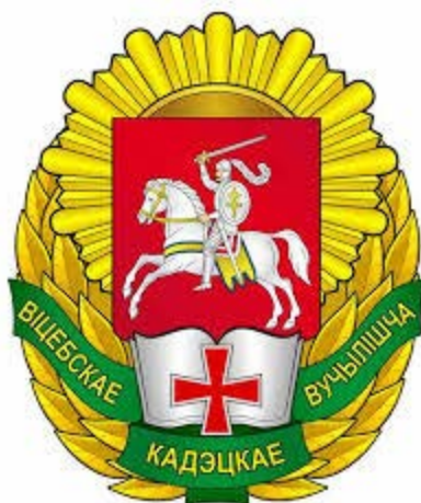
Герб Витебского областного кадетского училища

Несмотря на то, что в атрибутике кадетских училищ просматриваются национальные символы, в целом содержание учебно-воспитательного процесса, идеологической подготовки остаются сильно советизированным и русифицированным.