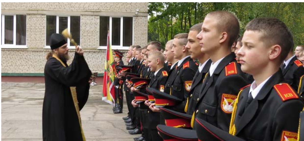
Кадеты Могилевского областного училища принимают присягу 35 .

В отличие от средних общеобразовательных школ, в кадетских училищах более открыто присутствует православная церковь. Православные священнослужители активно присутствуют на всех торжествах в училищах. Окропление является одним из главных ритуалов в процессе принятия кадетами присяги.