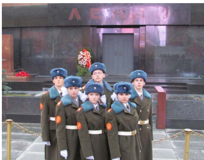
Ученики ВПК школы №134 г. Минск на экскурсии в Москве. Мавзолей Ленина 25 .