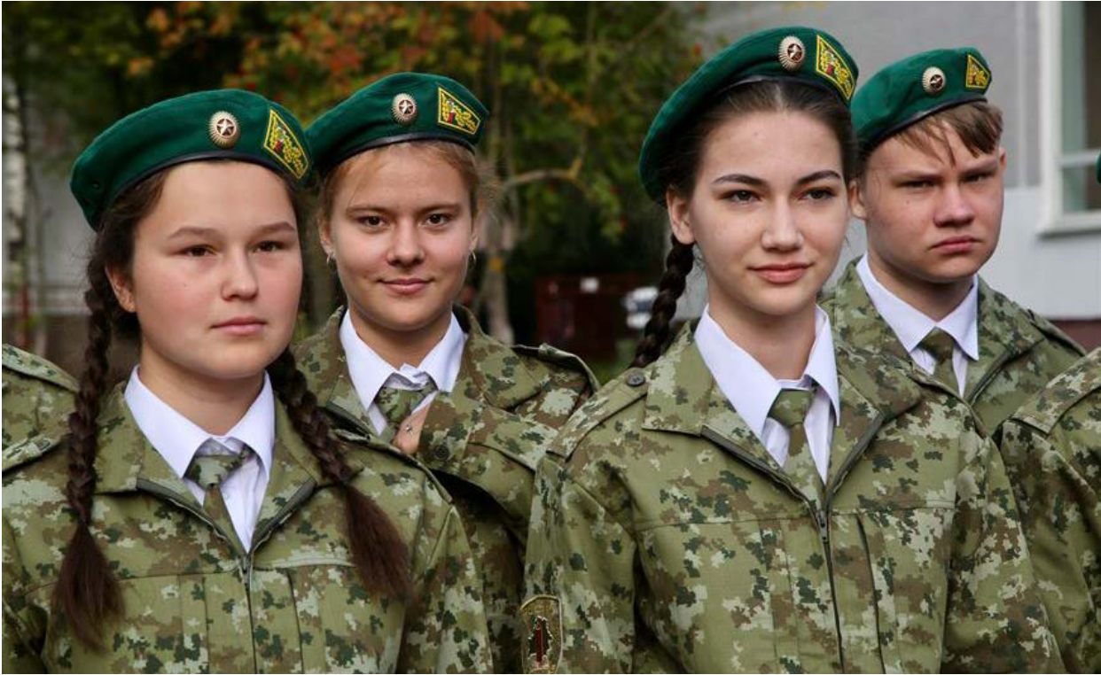
Торжественная линейка 1 сентября 2020 года учеников 10-го класса минской средней школы №206 22 .