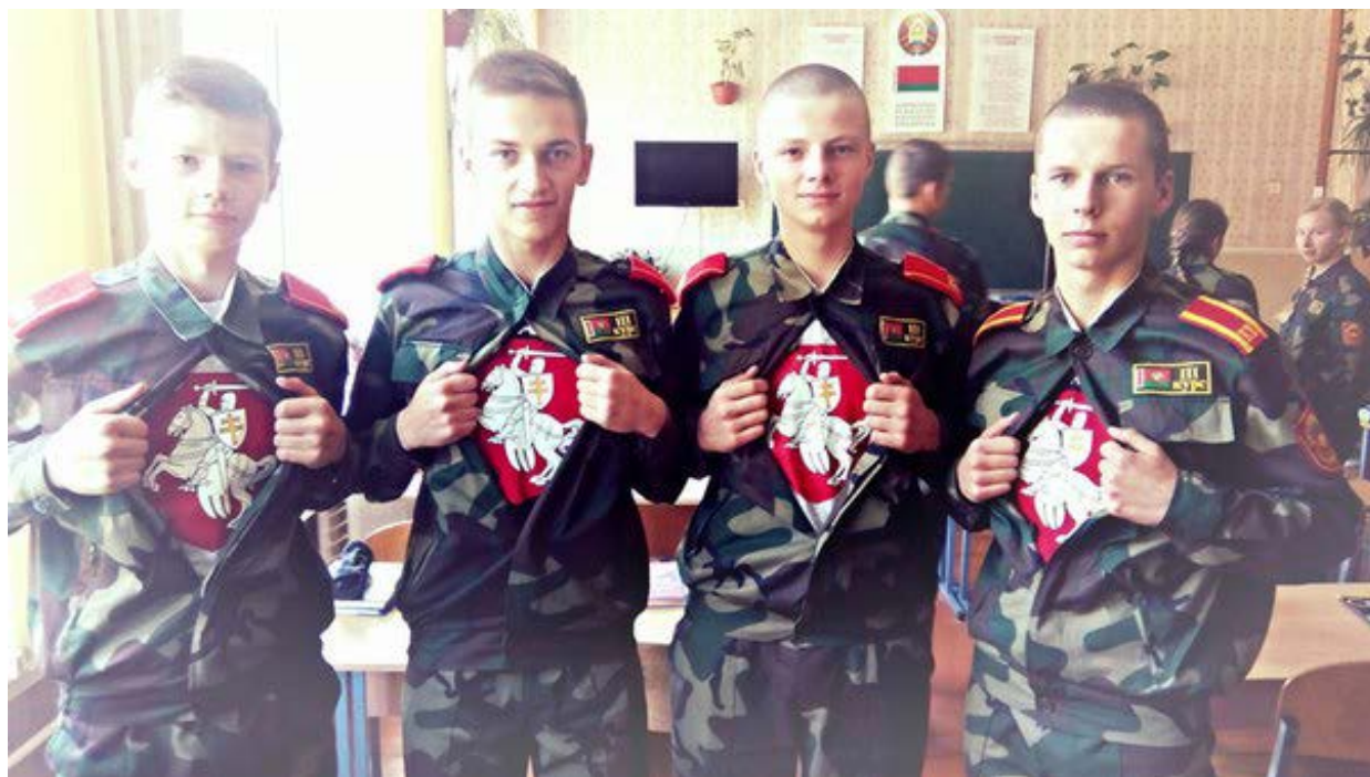
Курсанты Брестского областного кадетского училища позируют в надетых под форму майках с белорусским историческим гербом «Пагоня» 32 .

Воспитание и обучение ведется по стандартным идеологическим шаблонам. Исключительная опора на исторические события и память времен ВОВ, советскую историю (Война в Афганистане) и денационализация сознания. К примеру огромным скандалом и ЧП в 2015 году было то, что несколько кадет Брестского областного училища выложили свои фотографии в соцсети, где они в майках с белорусской «Пагоней». На кадет оказывалось огромное психологическое давление, вплоть до угрозы исключить из училища.