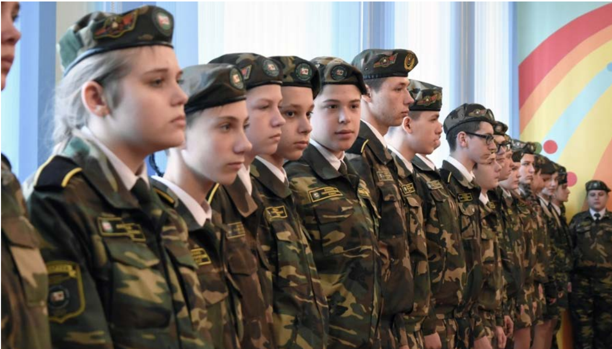
Военно- патриотический класс в СШ № 3 г. Гомель 23 .